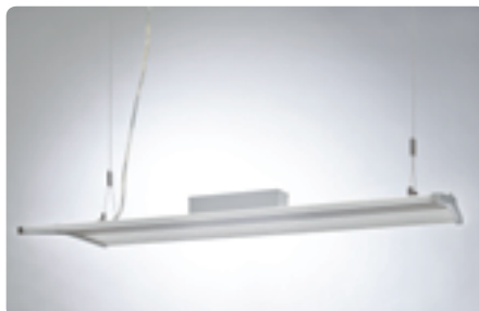
CODIA LED 8030 40W-NW